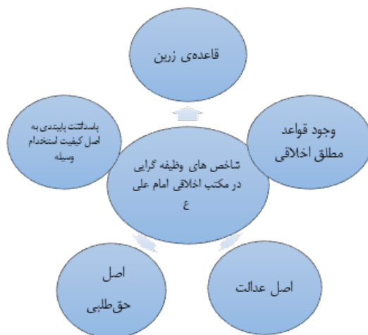
شکل ۲. شاخص‌های وظیفه‌گرایی اخلاقی در مکتب اخلاقی امام علی(ع).